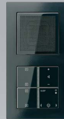
Das JUNG Radio

Auch für die Netzwerktechnik sind sämtliche Komponenten im Programm Acreation erhältlich. Spezialisierte und optisch schöne Lösungen für die Datennutzung und -verteilung im privaten wie gewerblichen Bereich sind so kein Problem.